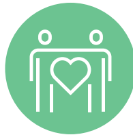
Miembro de su familia